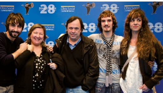
Actores y directores de 'El Extraño Anfitrión'.