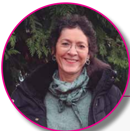
Lurdes Lekuona Zalduondoko kultura elkartea

dute, "ohitura asko aldatu eta euskara geroz eta gehiago erabiltzen lagundu digulako". Aisialdiarekin, hezkuntzarekin eta baso-lanekin lotutako jardueraz gain, aipatzekoa da kooperatiba diziplina anitzeko talde batek osatzen duela, eta hainbat arlo hartzen dituela. Lan hori aurrera eramateko, etorkizunean ere Euskaraldia lagungarria izango dela uste dute, "baina ordurako euskaraz lan egiteko ohitura finkatua egotea espero dugu".