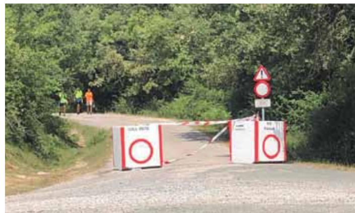
Pasa den urtetik dago itxita Zumarraundi bidea. ZALDUA MENDI TALDEA

Ildo beretik, gazteek beste idatzi bat zabaldu dute bere egotzaren berri emateko.