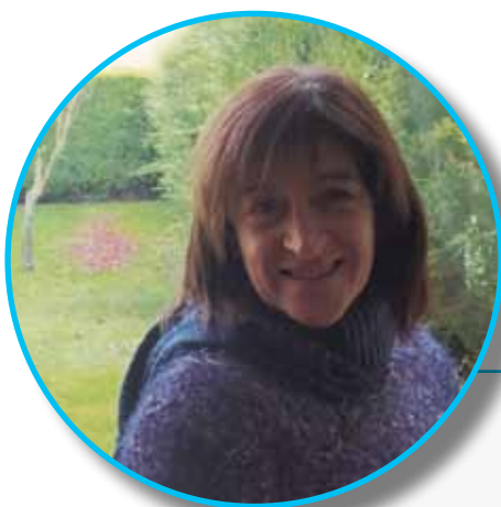
Adeli Fernandez Dulantziko dantza taldea

biztanle askok erderaz hitz egiteko joera izaten dugu, eta aukera bat da txipa aldatzeko eta euskaraz harremanetan jartzeko". Udaletxeko ariguneak euskaraz komunikatzeko abagunea garrantzitsua eskaintzen duela gogoratu du. "Udalean euskara, ez bakarrik alderdi ofizialean, herritarrekiko solasaldietan ere egon behar da. Beraz, etorkizunean ere kontuan hartzeko erabilgarria izango da. 'Burguko ariguneari' eutsi beharko genioke, etorkizunean euskarazko harremanak mantentzeko".