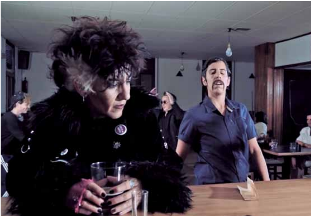
'Bakarrik taberna batean' bideoklipa Araiako Casino tabernan grabatu dute. 'BAKARRIK TABERNA BATEAN'