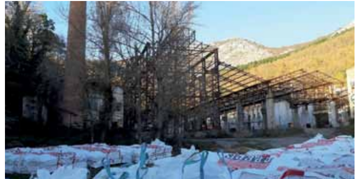
Fibrozementua kentzeko lanak egin dituzte Ajuria fabrian. ASPARRENEKO UDALAK

Arazoa da Arabako Diputazioak berak ez duela garraio publikoa zuzenean kudeatzen; gure kasuan, Nafarroako Gobernuaren eskuetan uzten du. Lautadan dauzkagun autobusak dira Nafarroako Gobernuak Gasteizera joateko jarritako lineak. Nafarroako Gobernuaren menpean gaude, eta horrek ez du zentzurik. Diputazioari eskatzen dioguna da beste kuadriletan egiten duen bezala egin dezala Lautadan ere; ez dugu besterik eskatzen. Hain justu ere, Diputazioak kudeatutako zerbitzua izatea, beste kuadrillek dutena. Eta horrekin lotuta, bidaiak merkeagoak izatea, izan ere, Gasteizera joateko ez dugu Bat xartela erabiltzeko eskubiderik.