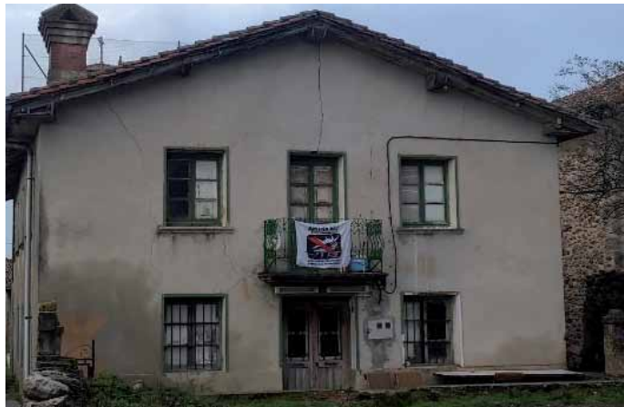
Langarikan okupatutako etxea. ALEA

Besteak beste, gogorazti dute landa eremuko populazioa zahartzen ari dela eta gazteek aurrera eramanez nahi duten proiektuak