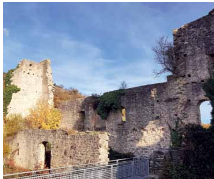
XIV. mendean eraiki zuten Gebarako jauregia. NAIARA LOPEZ DE URALDE

Orainaldira itzuliz, 1964. urtean, Aldundiak ipar-mendebaldeko dorretxea eta harresiaren zati batzuk eraberritu zituen. Hogei urte geroago, 1984an alegia, Monumentu Historiko Artistikoa izendatu zuten, eta ondoren, Espainiako Ondare Historikoari buruzko Legearekin modu generikoan babestu zuten. "Gerora, bisitariak hartzeko egokitu zen, baina honakoa izango da antzeztutako bisitak egingo diren lehenengo aldia", argitu du Gilek.