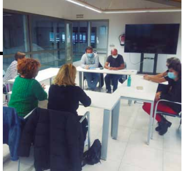
Aguraingo bikoteek 'ulerrizketa' formazio saioan parte hartu zuten. LEK

Saio hau beste urte batean egin izan balute, emaitza desberdina litzatekeela uste dute, baina aurtengo prozesuak ere emaitzak utziko dituela seguru daude denak. "Uste dugu esperientzia honek txipa aldatzen lagunduko digula. Gogotsu gaudela, eta hau gure bidearen hasiera dela uste dugu", nabarmendu dute Txo Txerbel kuadrillako kideek.