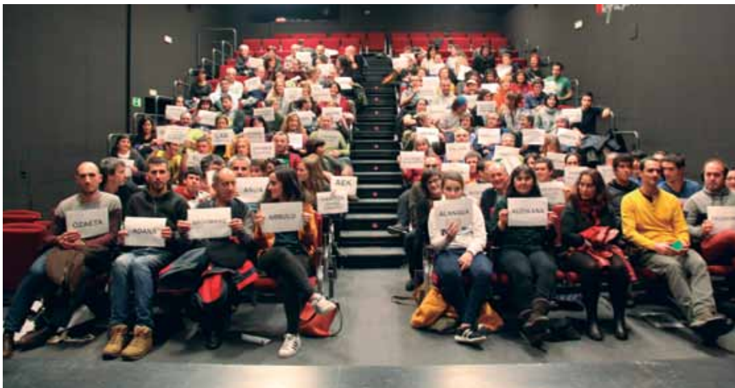
Lautadako Euskararen Komunitatea, azaroan Dulantzín egin zuten asanbladan. LEK