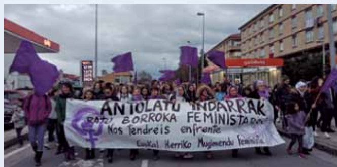
Agurainen, Martxoaren 8an egindako manifestazioa. MUGIMENDU FEMINISTA

Egun, hauek dira Lautadako mugimenduaren ildoak: "Ospatu" beharreko egun horietako kontzentrazioez gain, berdintasun