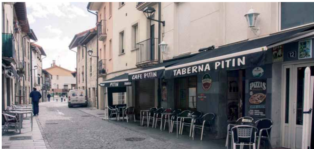
Besteak beste, Dulantziko Pitin tabernak parte hartu du bertako udal kanpainan. DULANTZIKO UDALA