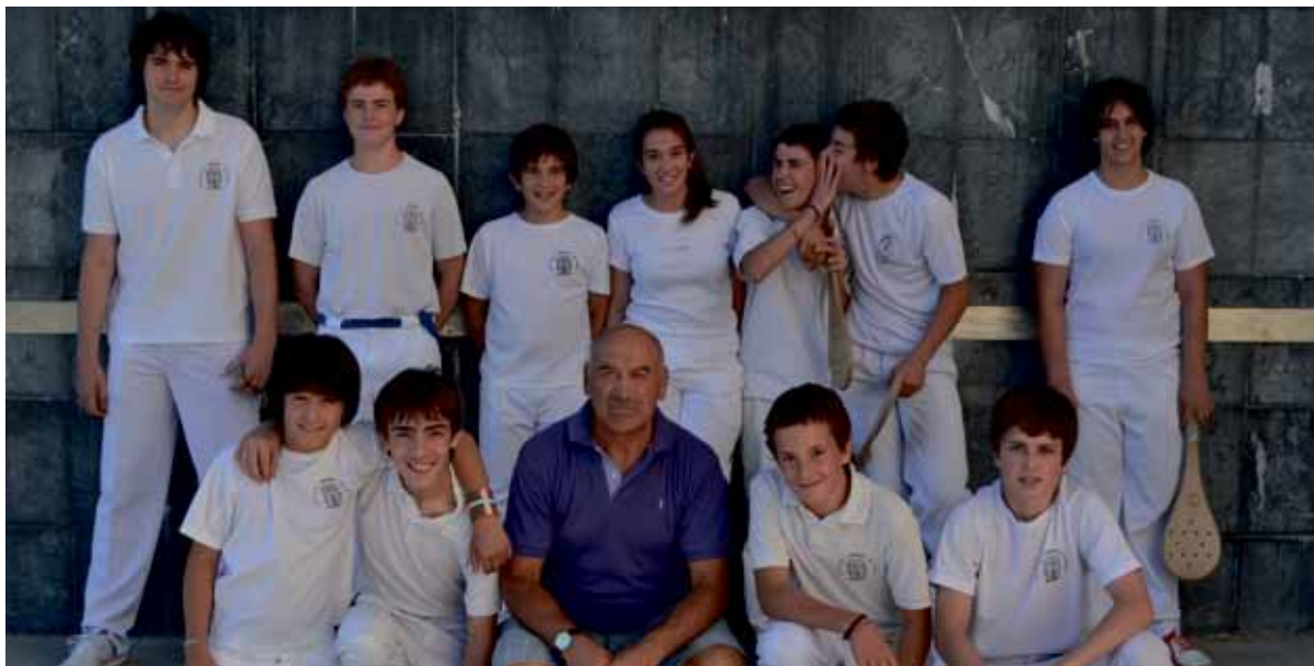
Udaletxean omenaldia egingo diete, larunbat arratsaldean, Aguraingo Lezao taldeko pilotariei.