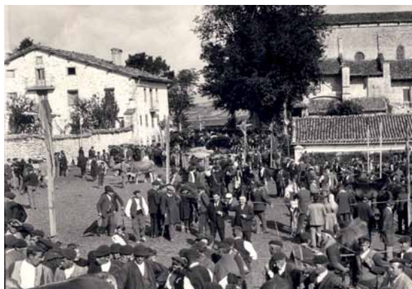
1395. urtean ospatu zuten lehenengoz ganadu azoka.

Berrikuntzen artean, gainera, aurten indarkeria matxista gaitzetsiko duen kanpaina abiatuko du Udalak. Eskuorri, pegatina eta bestelako materialak banatuko dituzte, Martinek azaldu moduan: "Puntu