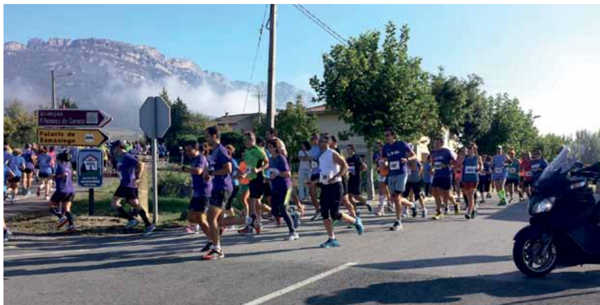
Erdi maratoiak eta patin lasterketak 21 kilometro inguru zituzten; herriguneak eta mahastiak zeharkatu zituzten. | ARABAKO ERRIOXAKO ERDI MARATOIA