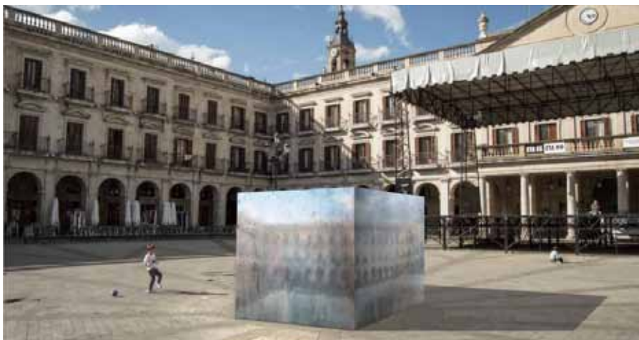
Aluminio paperarekin bildutako hainbat kubo eta bolumen ezarriko dituzte igandetik aurrera.