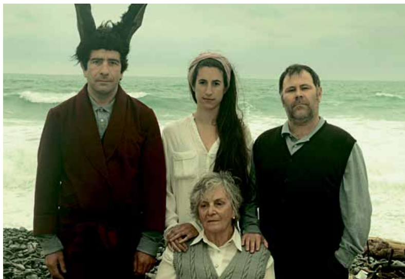
Huts taldeak 'Etxeoak' lana aurkeztuko du azaroaren 4an. |ALEA

eta Gorakada taldearen Moby Dick izango dira. Eta klasikoekin ere gozatzeko aukera izango dute zaleek, abangoardiako zuzendarien eskutik: