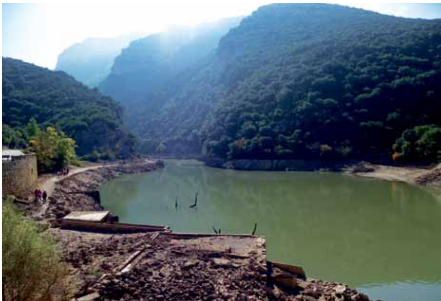
Sobrongo haitzarteko errepede zaharra ikus daiteke egunotan.