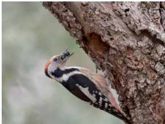
Izkiko parkean, ugariak dira okil ertainak.

Ekintza guztiak aurrera atera ahal izateko 1,1 milioi euro jarri izan dira; Diputazioko eta Europako funtsek erdi bana finantzatu dute.