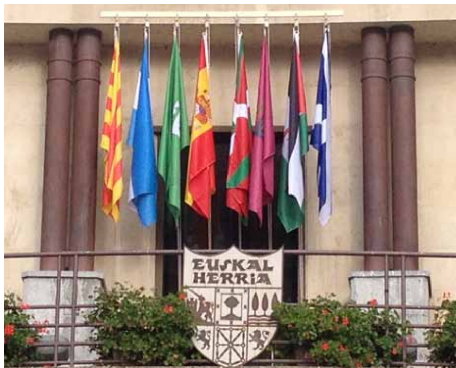
Zortzi ikur daude orain Laudioko udaletxeko balkoian.

Luzea izan den prozesuaren ondorioz -Laudioko Udalak bi helegite aurkeztu