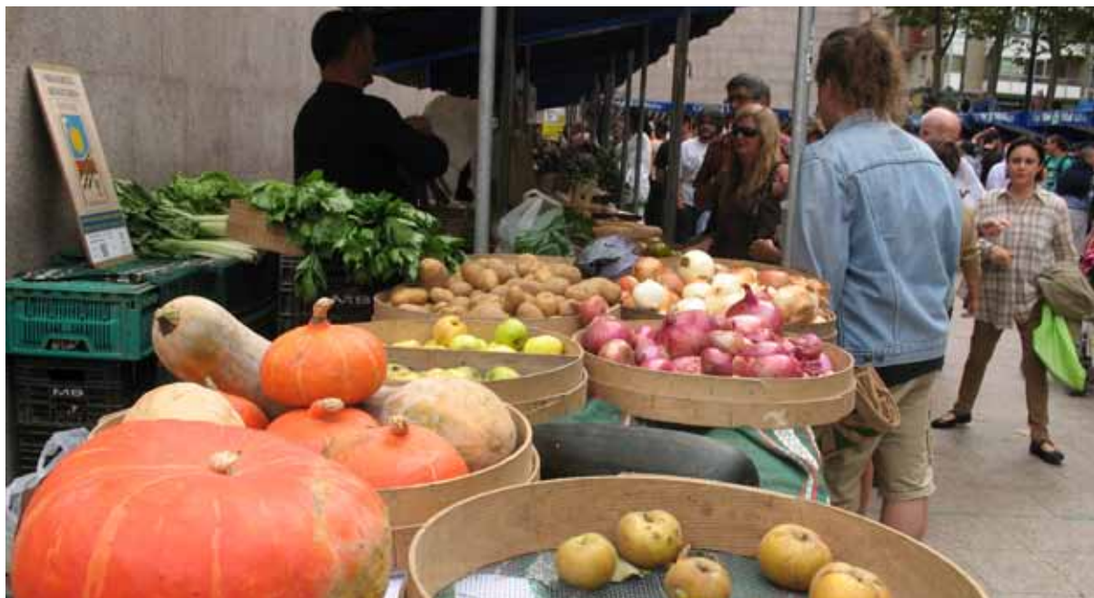
Larunbatean ospatuko da Gasteizko Foru plazan Bionekaraba azoka ekologikoa; aurretik hainbat jarduera antolatu dituzte. | MENDIOLA ARABA