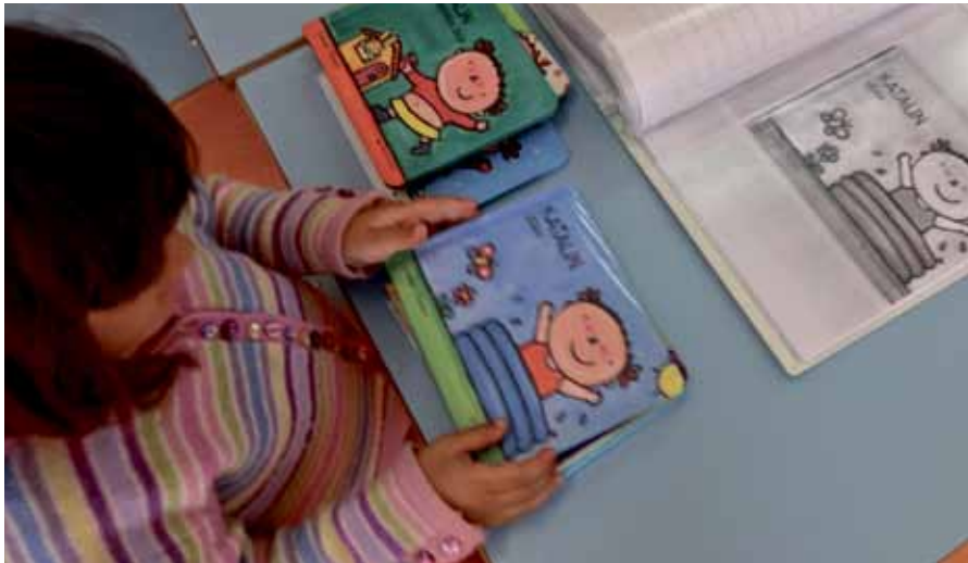
Irakurketa giroa sortzea bilatzen du egitasmo berriak.