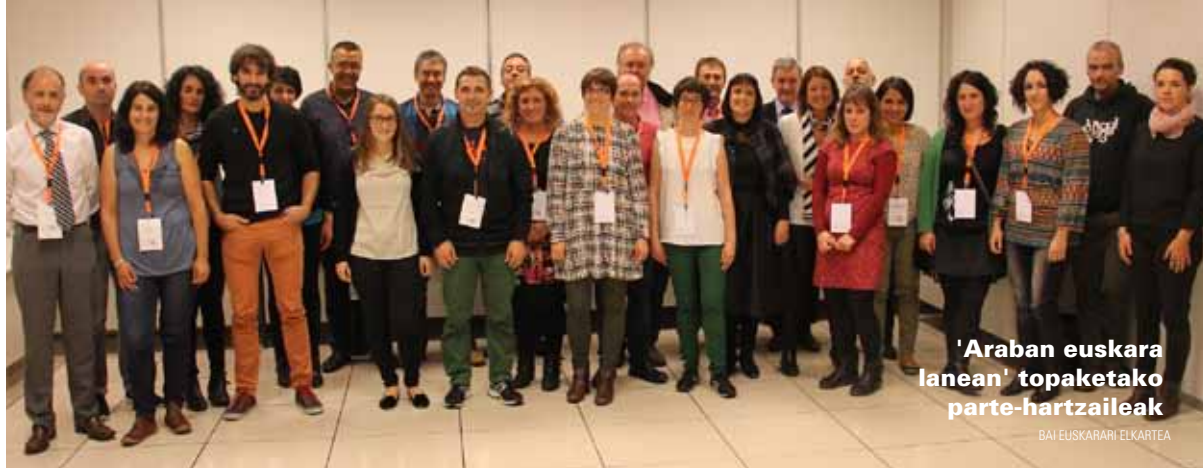
'Arabán euskara lanean' topaketako parte-hartzaileak