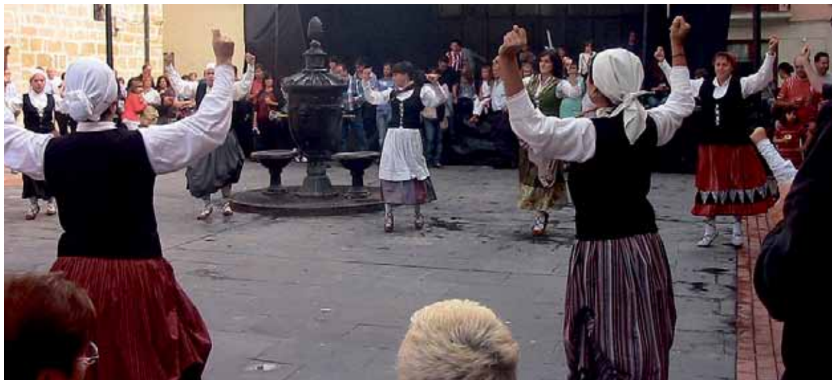
Dantzariak herriko plaza hartuko dute igande eguerdian. | JAVIER VEGAS FERNANDEZ