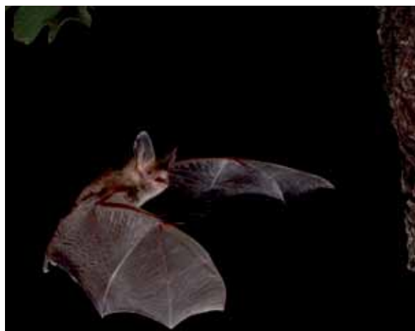
Bechstein saguzarra zulo batetik irteten. | A.D.