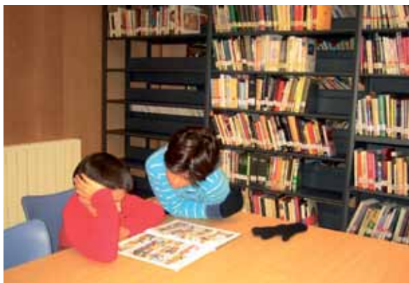
Bi ume Oiongo liburutegian irakurtzen.

Landak gogorarazi du erraza dela horretan parte hartzea: "Liburuak irakurri eta dagokion fitxa bete ostean, Arabako Errioxan liburutegia duten herrietan aurkeztu behar