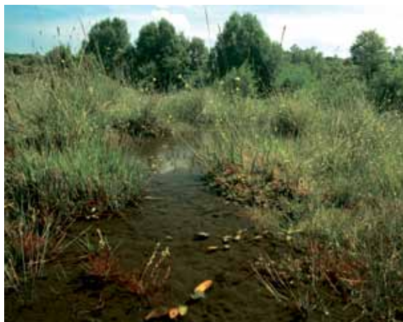
Galbaniturriko zohikaztegiko landareak. | A.D.