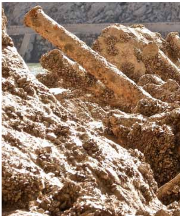
Zebra muskuilu ugari agertu dira urtegian.

Sobrongo urtegiak gordetzen dituen sekretuek jende andana erakarri dute Araba eta Burgos arteko muga egiten duen Sobron haitzartera. Ingurua berez ederra bada, are gehiago