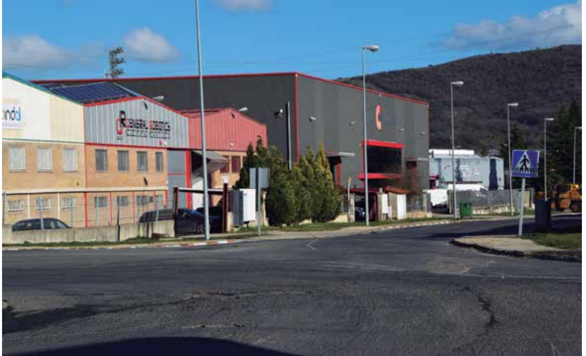
Garraio ardatzen inguruetan kokatu diren industria jarduereri esker aberastasun tasa altuak ditu Gorbeialdeak. PHOT.OK