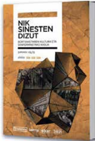
'NIK SINISTEN DIZUT'