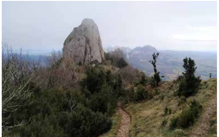
Tartean, San Tirso, Toloño eta Aratz mendietara igotzeko bideak daude zerrendan.

Inguruetako informazioa bilatzen hasi zenean, ordea, gehiena gaztelaniaz zela ohartu zen. Horregatik, euskarazko webgune bat martxan jartzea erabaki zuen. Hasierako asmoa zerbait sinplea eta argia egitea zen, eta halaxe izan da. Webgunean sartzean, bi botoi eta Euskal Herriko mapa bat besterik ez daude. Lehenengo botoiak informazio orokorrera bideratzen du irakurlea; bertan Geologia, Hidrografia,