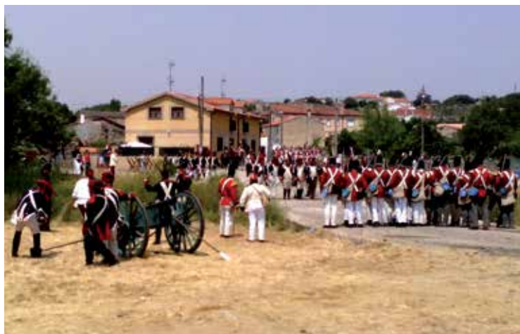
Tropen mugimendua, Lautadan berreginda. GASTEIZKO BATAILA 1813