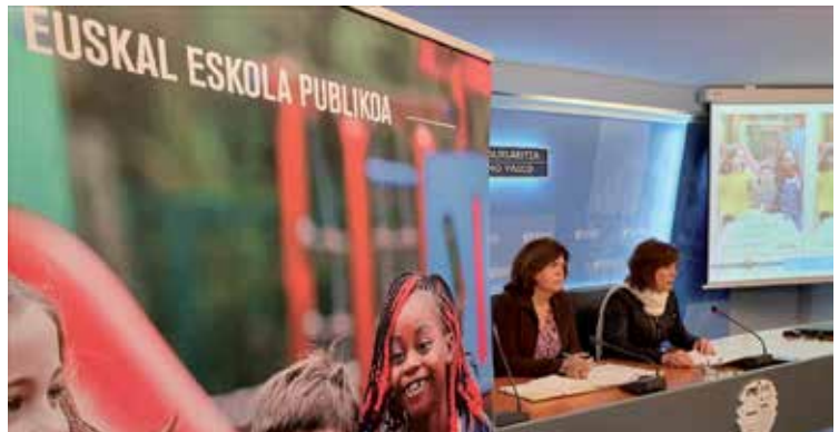
Otsailaren 7an amaituko da aurrematrikula kanpaina.

Publikoaren zaintzan eta kudeaketan ardura nagusia dutenek eskola publikoa bigarren leerroan kokatu nahi dutela iruditzen zaigu askori. Aspaldi piztu zen alarma kontu