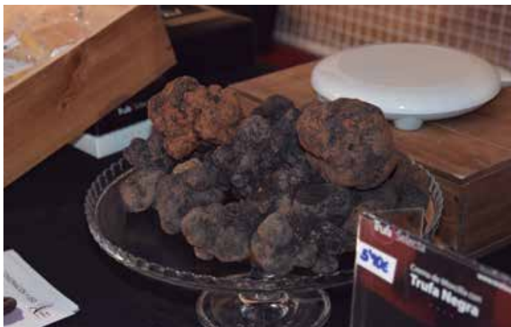
Boilur beltza erosteko aukera egongo da igandean, Ribabellosan. PHOT.OK

Bilketa kanpainarekin batera, eta "boilur beltzarekiko grina mundura zabaltzeko", igande honetan, otsailaren 2an, Boilur Beltzaren V. Nazioarteko Azoka antolatu dute Ribabellosan. Iaz,