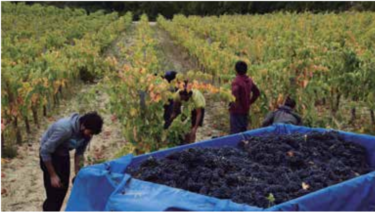
Arabako Errioxako Abra taldeko 40 upategik bultzatu dute ekimena. PHOT.OK