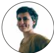
GIRA CRESPO HISTORIALARIA

I 875ean, Basamortuaren konkista hasi baino lehen, hau da, bere herriaren hondamena hasi baino lehen, Namunkura lider maputxeak buruzagi militar argentinar bati gutun bat idatzi zion: "Kristauek lursail bat kentzen zidatela amets egin dut. Kasu honetan, nik defendatzen ditudan lursail hauek kentzen badizkirate, orduan, kristauen artera joan eta kalte handiak egingo ditut eta hala jakingo dugu nork dezakeen gehiago".