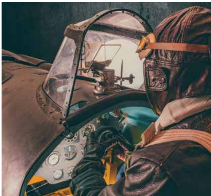
Polikarpov I-16 hegazkinaren berregitea.

Gutxi dira elkartean. Dozena erdi bat ikertzaile eta beste dozena erdi berregile. Horien garrantzia azpimarratu du Tabernillak. "Berregilea ez da