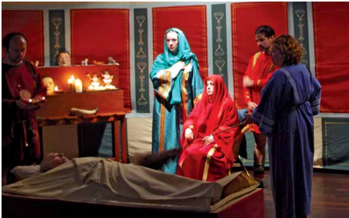
Erromatar garaiko hileta, Bibat museoa antzetzuta. COHORS PRIMA GALLICA

Ekainera bitartean, entseguetan jarraituko dute, eta seguruenera Inperioa erori aurretiko erromatarrek godoei aurre egiteko bideak asmatzen jarraituko dute. Zorte ona izan. ALEA IACTA EST. ■■■