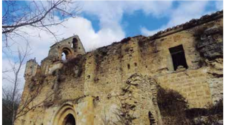
XIII. mendeko Riberako eliza erortzeko arriskuan zegoen. HISPANIAOSTRA

EH Bilduko batzarkide taldeak iaz egindako salaketaren ostean, eta Arabako Diputazioaren eta Go-tzaindegiaren hitzarmenari esker, hondamenditik salbatu da XIII. mendeko Riberako San Esteban eliza erromanikoa. Besteak beste, elizaren fatxadak harrobiarekin sendotu dituzte, eta egurrezko leihoak jarri dituzte. Valderejoko parke naturalean dago tenplua.