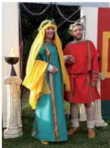
Erromatar ezkontza. COHORS PRIMA GALLICA

IDAZKIETARA EZ EZIK, ITURRI ASKOTARA JOTZEN DUTE BERREGITEAK EGIN AHAL IZATEKO