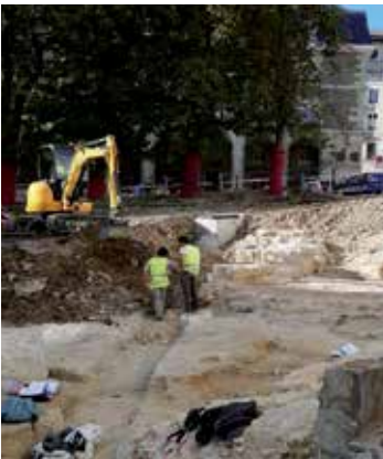
Bankuaren inguruko obrak. ALEA