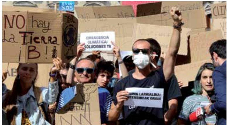
Klima larrialdiaz ohartarazteko protesta, Gasteizen. ALEA

Unai Pascualen aburuz, bioaniztasunaren galeraren arazoaren erdigunean gizartea eta ekonomia daude: lurraren eta itsasoaren erabilera, natura-baliabideen zuzeneko esplotazioa, klima-aldaketa, kutsadura eta espezie inbaditzaileak. Baina, oinarrian, zeharkako eragileak daude: gizabanakoaren portaeren eta balioen aldaketa, kontsumo eta ekoizpen ereduak, nazioarteko