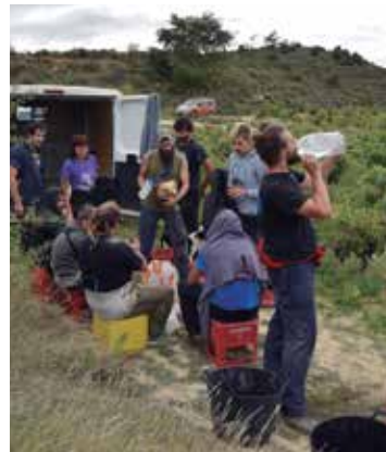
Besako kuadrilla, hamaiketakoan.

Besaren mahastietan lana bizpahiru egunetan amaitzea espero dute. Orain, langileen taldea furgonetaren inguruan bildu da, hamaiketako egiteko. Kezkak eta artaziak alde batera utzi dituzte une batez, eta txantxetan dabilta. ■■■