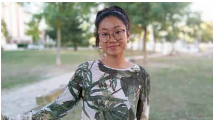
Herri Txikien Eguna antolatu dute datorren larunbaterako, Argantzonen. ESTI LANA O .

Etekin ekonomikoak alde batera utziz, gure helburu nagusia, esan bezala, Arabako herri txikitako gazteen arteko harremana indartzea da. Jaialdi honekin aurrekari bat finkatu nahi dugu, ondoren etorriko denari bidea egiten hasteko. ■