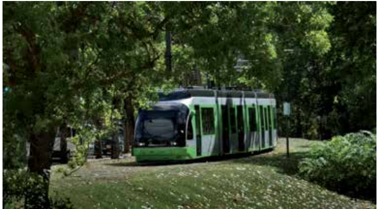
Ez da galdeketerik izango Salburua eta Zabalgana lotzeko ereduaren inguruan. ALEA

"Gasteizko auzo berriak eta Erdialdea lotzeko: tranbiaren azpiegitura luzatu ala Autobus Elektriko Adimendua (AED) ezarri?" Gaiaren inguruan EH Bilduk proposatutako herri galdeketa egiteari uko egin dio Gasteizko udalbatzak. Elkarrekin taldearen bablesa izan arren, EAJ eta PSEren ezezkoak eta PPren abstentzioak atea itxi diote kontsultari.