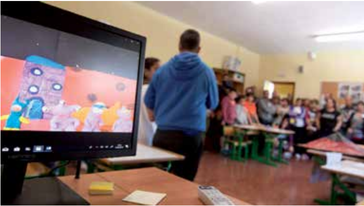
Oiongo Ramiro de Maeztu eskolako ekitaldi bat. RAMIRO DE MAEZTU