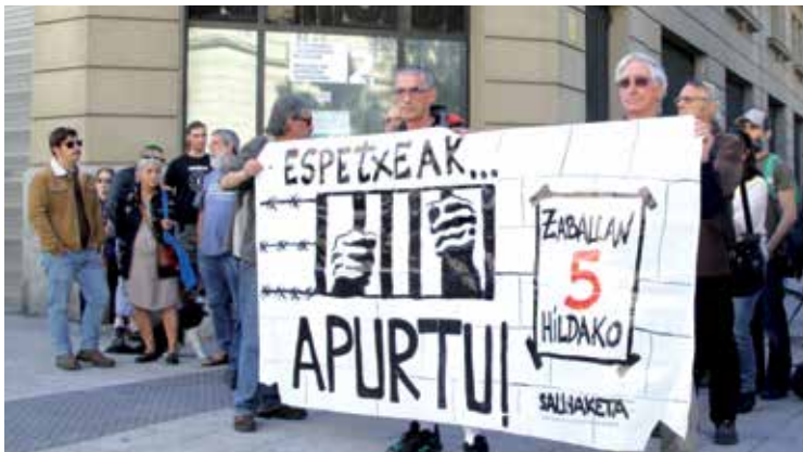
Gasteizen salatu dute Arabako espetxearen egoera. ALEA