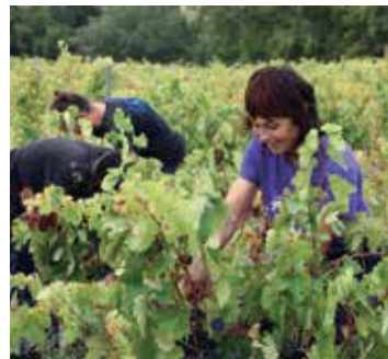
Esti Besa mahastizaintzan.