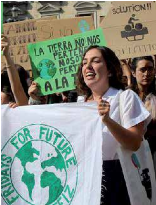
Gasteizko Plaza Berrian egin zuten protesta.

"BADIRUDI BIDEA EGITEN ARI GARELA, BAINA EZ DUGU LORTZEN HASIERAKO OINARRIAK JARTZEA"