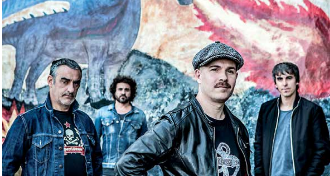
Gasteizko Jimmy Jazz aretoan joko du ostiralean Gatibu talde bizkaitarrak. GATIBU

beraz, hor dago seinalea, kantuak norbaitengana iritsi direla. Azken helburua hori bera denez, oso pozik gaude. Hogei urte pasa ostean, gailurrean jarraitzen duzue askotariko adinetako jendea kontzertuetan batuz. Lan batetik bestera berrikuntzak sartzea izan daiteke taldearen arrakastaren gakoa?