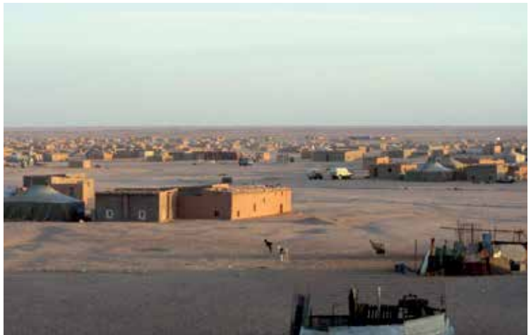
Algeriako Hamada izenez ezagutzen den Sahara basamortuko kanpamentua. AFANIS

Hainbat aldiz izan naiz, eta hemen duela 50 urte bizi zutena