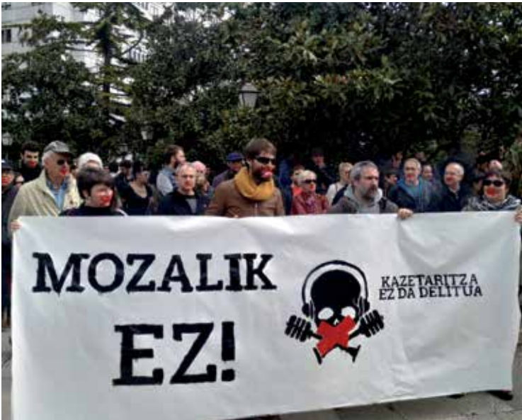
'Kazetaritza ez da delitua' pankartarekin, elkarretaratzea egin dute epaitegietan. H. BEDI