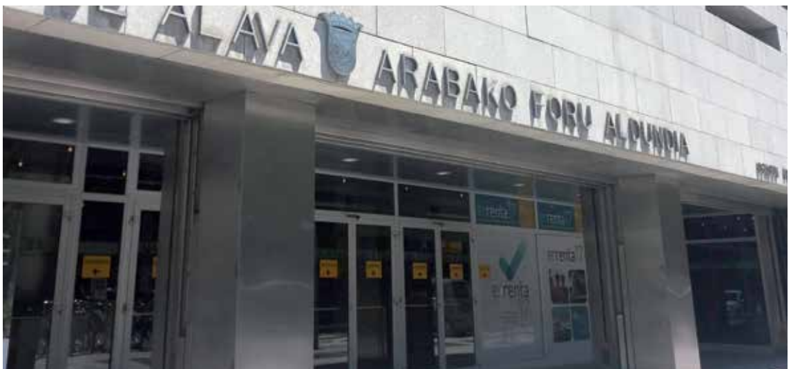
Aurrez egindako aitortenak onartzeko, edo horiek aldatzeko hitzordua eskatu aldera, doako telefonoak prestatu ditu Ogasunak. ALEA

Ondarearen gaineko zergaren kanpaina ere abiatu dute. 1.540 arabarrek egin beharko dute aitorten hori: 2 milioi euro baino gehiagoko ondasun edo eskubideak dituztenak edo 800.000 euro baino gehiagoko ondare garbia duten lagunak, hain zuten. Hauen partez 17,5 milioi euro jasotzea espero dute; batez bestean, 11.364 euro inguru bakoitzeko.