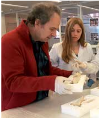
Zazpi adar zaharberitu dituzte. CENIEH

Trebiñuko Pozarrate aztarnategian iaz aurkitutako zazpi orein-adarrak kontserbatzeko lanak bukatutzat eman ditu CENIEH Espainiako Giza Eboluzioaren Ikerketa Zentroak. Iberiar penintsulan inoiz aurkitu den adarrez egindako meatzaritza tresna sortarik handiena da, duela 6.000 urte ingurukoa. Neolitoan silexa lortzeko erabili zituzten.