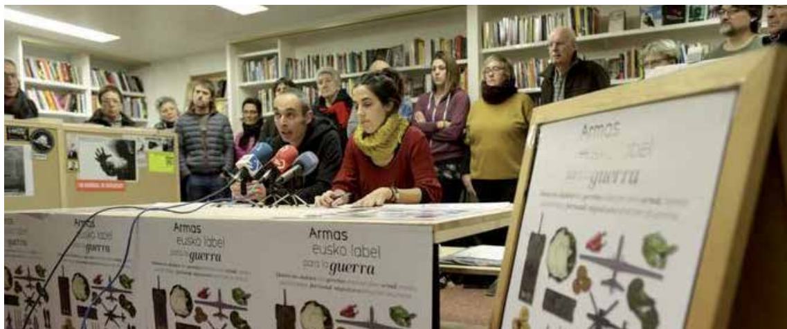
Gerrarako Eusko Label Armak ekinaldia aurkezteko egindako agerraldia. ALEA

Bitartean, milaka kilometrotara, pasa den urtera arte Bilboko portuan ontziraturako bonbak Yemenen etengabean erortzen dira, euskal piezez hornitutako Eurofighterrek Yemen eta beste herri batzuk bonbardatzen dituzte edota hemengo enprekin kolaborazioak dituen sektore aeronautiko sionistak palestinarren garbiketa ahalbidetzen du. Era berean, euskal unibertsitate publiko zein pribatuetan garatzen den ikerketak eta sinatzen diren hitzarmenek heriotza-industria honetan topatzen dute ere beren aplikazioa. Beste herrietako biktimen odolak ez du Euskal lurra zipriztintzen fisikoki baina hemengo enpresa, instituzio eta langile asko