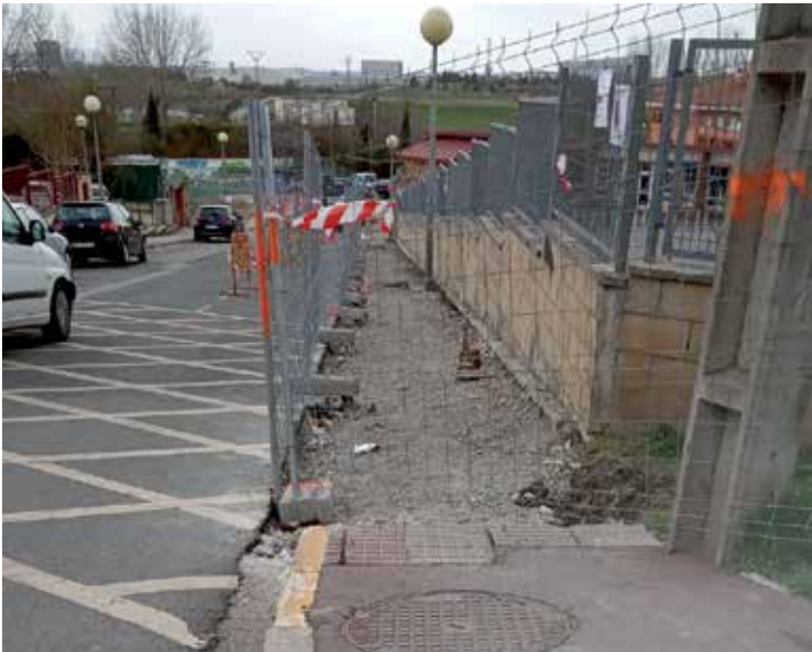
Udalak lanen inguruko informaziorik ez duela eman diote gurasoek. AGURAINGO GURASOAK