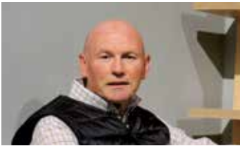
JUAN JOSE IBARRETXE LEHENDAKARI OHIA

"Emakumeek ere saskiratzen dutela deskubritu dute batzuek Erreginaren Kopan"