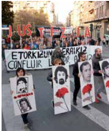
Justizia eskatu dute manifestariak.

1976n Espainiako Poliziak Gasteizen hildako langileak omendu dituzte igandean, eta haiek egindako borrokaren balioa aldarrikatu dute, gaur egungo borroka sozial eta politikoekin uztartuta. Egunean zehar alderdi politiko eta sindikalek hainbat omenaldi egin dituzte, eta, arratsaldean, lore eskaintza eta manifestazio jendetsua egun dute.