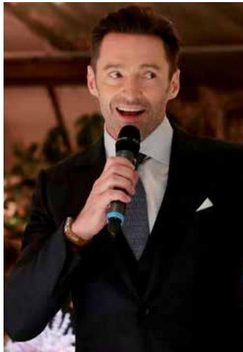
'THE FRONT RUNNER'

Une idiliko horretan ustekabeko zerbait gertatzen da, eta Reitman zuzendariak bi minututan Harten amildegi politikorako bidea maisuki