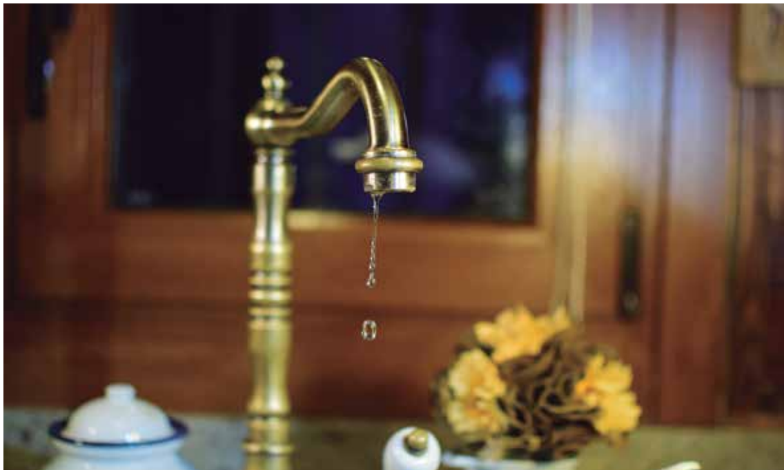
Arabako herrietan etxeetako uraren horniduraz kontzejua eta udalak arduratzen dira. PHOT.OK