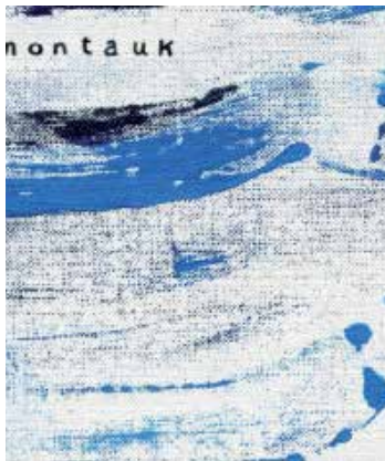
'Geruzak' lana. MONTAUK.

Bai, hasierako soinuaren helburuetako bat beharbada ikutu ilunago, ingelesago batzuk lortzea zen, eta beste bide batzuetatik joan zen. Eta bigarren honetan uste dugu lortu dugula buruan genuen hori, eta Ingalaterrara hurbildu gara pixka bat.