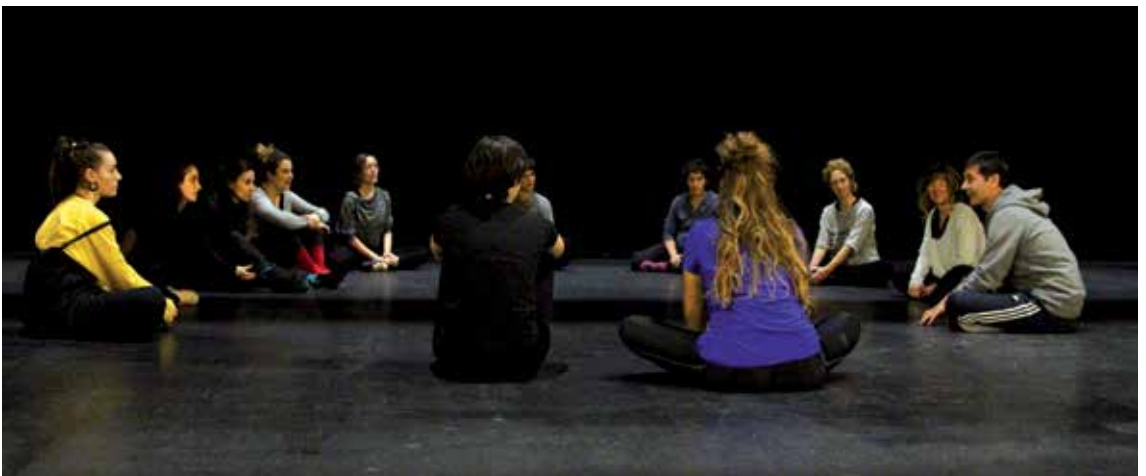
Dantza tailer bat eskaini zuen Mayak, joan den astean, Gasteizko Ibaiondo gizarte etxean.

Bai. Adibide modura, aurrekoan kazetari batek galdetu zidan zenbat neska eta zenbat mutil dauden taldean. Berdintasun batean kokatu nahi dugu askotan, eta galdera horiekin genero ezberdintasuna bultzatzen ari gara. Nik ez dizut esango zenbat mutil eta neska dauden, zenbat