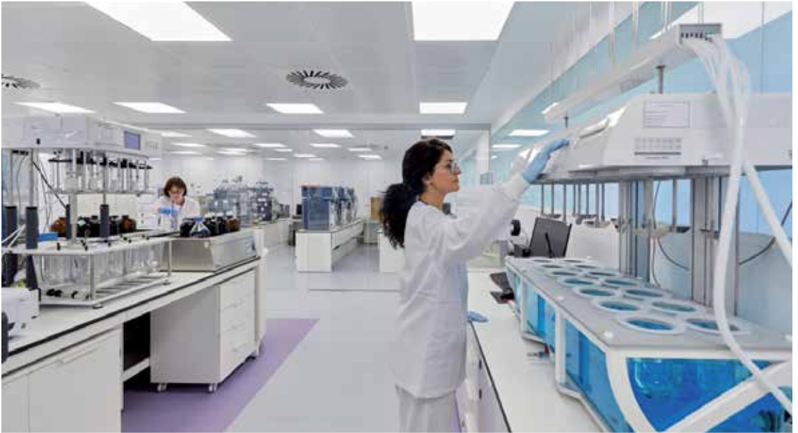
1,5 milioiko inbertsioa egin dute laborategi berria martxan jartzeko.