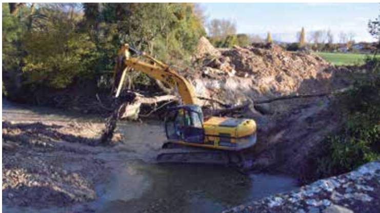
Angostoko El Rabero zubiaren inguruan ari dira orain lanean.

Villanañeko isuriak Espejoko araztegiarekin lotzeko lanak otsailean amaituko dituzte. 1,2 milioi euroko inbertsioa egin du Arabako Foru Aldundiak kolektoreak eta hodiak jartzeko. Hala, Espejoko araztegiak zerbitzua emango dio aurki Villanañe herriari, Angostoko kanpinari eta santutegiari; etorkizunean ere Uribarri Gaubearekin lotuko da.