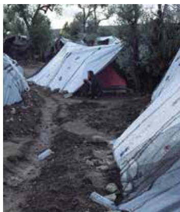
Kanpamendu bat, Grezian. ZAPOREAK