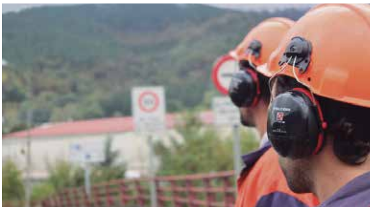
Tubos Reunidos enpresak Amurrión duen lantegia.

Tubos Reunidos enpresako agintariek adierazi dute lan erregulazio espedientea ezarri nahi dutela 2018ko azarotik 2020ko otsailera arte. Antza, beharginek erdira murriztu beharko lukete lanaldia, edo %56ra, gehienez. Hala eta guztiz ere, negoziazioak ez dira amaitu. Lantegiak eskariak jasoko balitu, lanaldia handitze-ko parada izango luke.