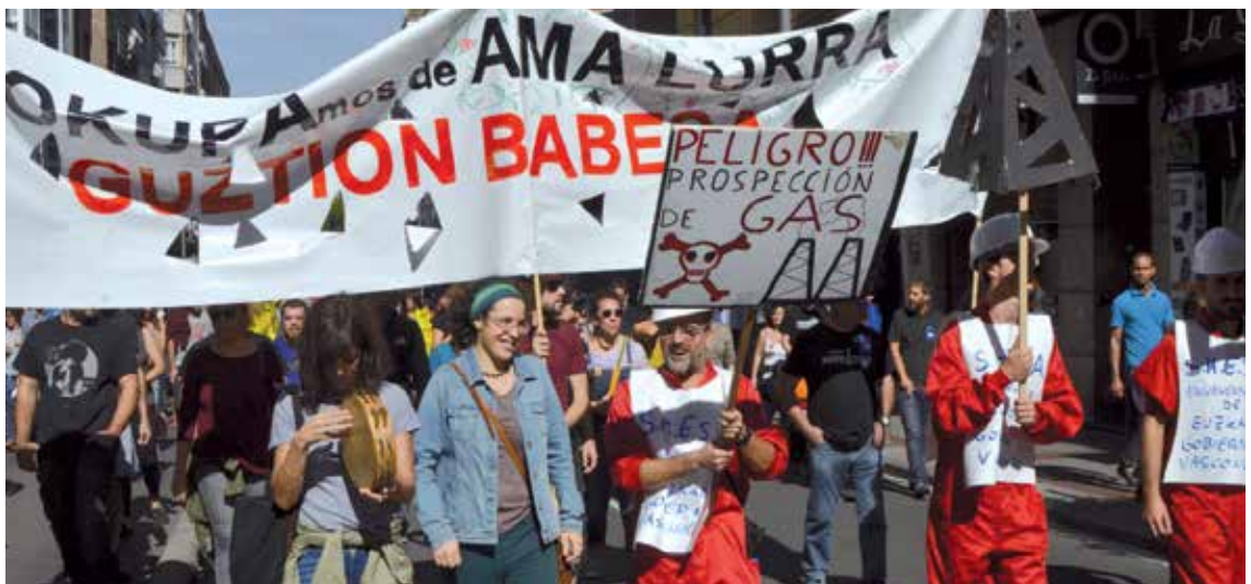
Armentia-2 putzuari buruzko herri galdeketa eskatu dute, baina Udalak ezezkoa eman dio, EAJ eta PSE botoekin.