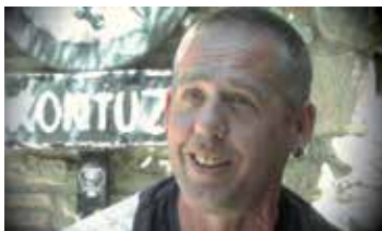
TXERRA BOLINAGA RIP TALDEKO KIDEA

"Harrera familia gehiago behar dugu Araban haurrak laguntzeko"