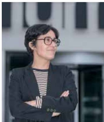
Herraek zuzenduko du museoa. ARTIUM