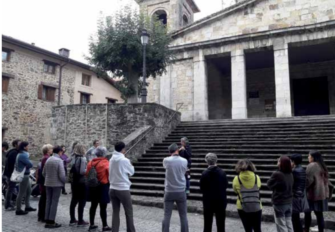
Pasa den dokeman egindako bisitan 22 lagunek parte hartu zuten. AMILLEN ELKARTEA

goizetan izatea bisitak; euskaraz eta doakoak izango dira guztiak. Modu horretan, udalerrian bertan edo Gasteizen bizi denak badaki egun horietan Aramaion zerbait dagoela. Ondarearekin batera, historia eta natura ere landuko dugu. Euskal Herrian mendiak duen garrantzia kontuan izanda, natura txangoak ere prestatu ditugu. Aramaion badago Errez izeneko ingurumen aholkularitza, eta horren eskutik ohiko ibilaldietatik ihes egin eta inguratzen gaituzten baso eta errekak beste modu batean ezagutuko ditugu azaroko txangoan. Helduei zuzenduta egongo da hori. Bisitak, orduan, berezitatea daude? Bai. Batzuk familientzako izango dira: martxoan, bisita mitologikoa egingo dugu, eta maiatzerako "Betaurreko berdeak" izeneko ere aurreikusita dago: hain justu,