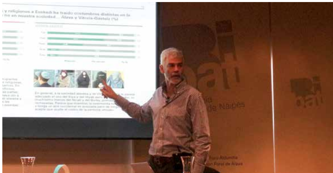
Asteazkenean aurkeztu dituzte Gasteizen 2018ko Barometroari buruzko datuak. ALEA