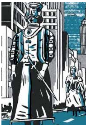
'BLACK IS BELTZA'

1965 urtean New Yorken hasten da kontakizuna, bertan San Ferminetako nafar