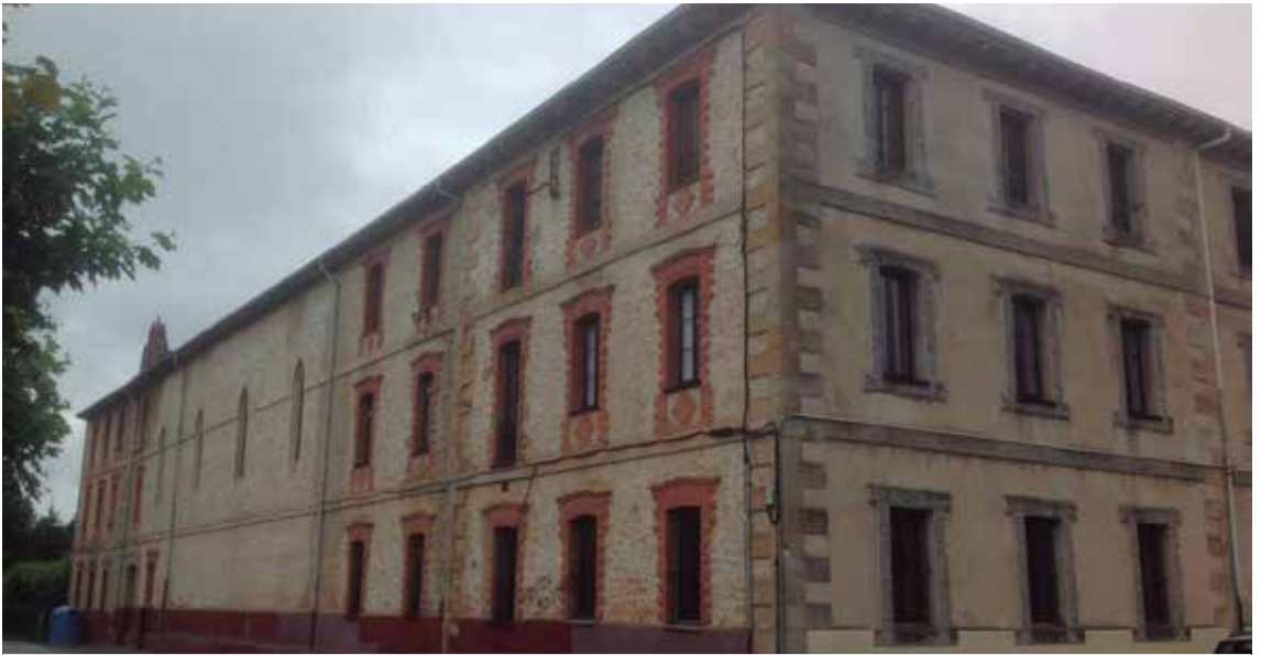
Pauldarren eraikinean Haur eta Lehen Hezkuntza kokatzeko egitasmoa geldituta dagoela salatu du Zuiako alkateak.