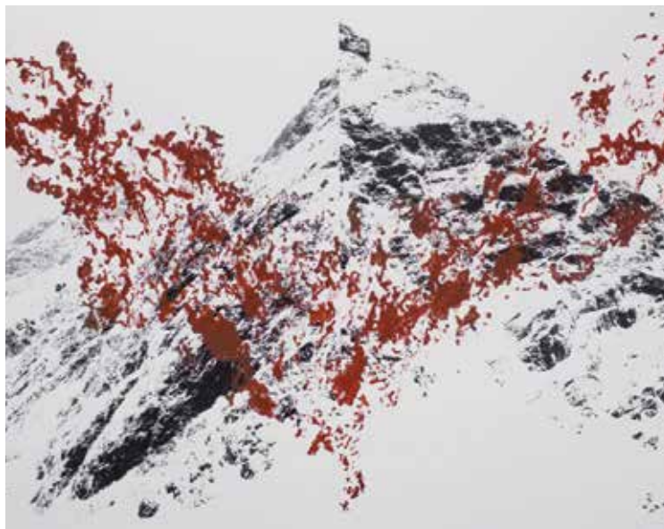
Urtarrilaren 20ra arte izango da erakusketa, Amerika aretoan. J. CAZENAVE

Erakusketa urtarrilaren 20ra arte izango da, baina horren aurretik, abenduan, artista bera erakusketaren inguruan prestatutako hainbat saiotan izango da. "Erakusketa bat ez da amaitzen aurkeztutakoan; hainbat jardura izango dira eta han izango naiz Ur Aitz konpainia egiten". ■