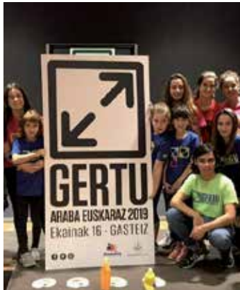
'Gertu' izango da jaiaren lema.