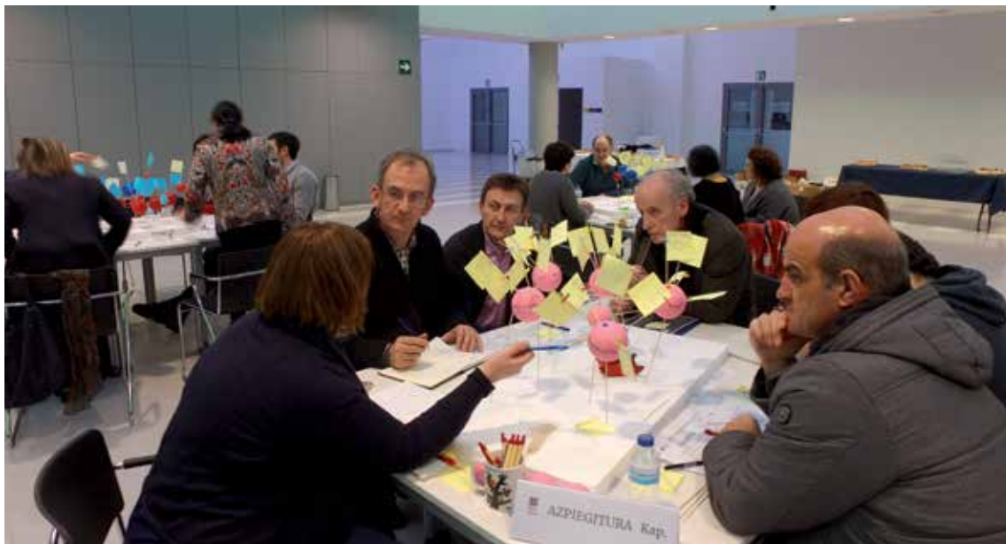
Orain arte, Euskararen Etorkizuneko Eszenarioak Elkarrekin Eraikitzen proiektuaren hiru mintegi egin dituzte Gasteizen.