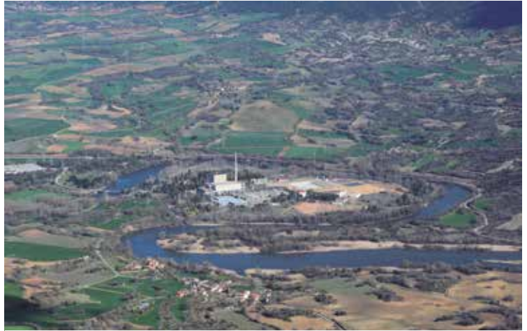
Garoñako zentral nuklearraren tokian biltegi nuklearra eraikiko dute. PHOT. OK

Printzipioz, Garoñako biltegian gordeko diren hondakinak Gaztela-Mantxako Villar de Cañas herrian eraikitzeko asmoa dagoen hilerri nuklearrera eramatea aurreikusita zegoen, estatu osoko