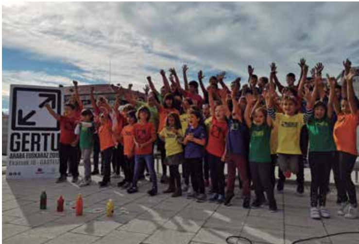
Araba Euskaraz 2019ko aurkezpena. ARABA EUSKARAZ

Errealitate sozialaren ezagutza faltaren arazoa, ikastoletan euskara ikastea erraz samarra delako gure hizkuntza ikastearekiko abegi ona erakusten duen masa soziala baita. Bixia da, halere, adituen arabera, irakaskuntza publikoaren eta itunpekoaren arteko datuak alderatzerakoan ez baita hainbesteko ezberdintasunik ikusten. Eta, horrez gain, eskola publikoan aurkitzen ditugun ikasleen jatorrizko hizkuntzak oso homogeneoak ez direla kontuan hartu behar dugu. Zabalana