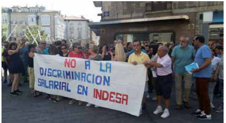
Garbiketa, janaria prestatzea, lorezaintza eta bestelakoak eskaintzen ditu Indesak. LAB

Gutxieneko soldata baino ez dutela kobratzen eta lan zama handiak dituztela salatuzko, elkarretaratzea egin zuten pasa den larunbatean Indesako langileek, Gasteizko Loma Jeneralaren plazan. Protestan sindikatu guztien babesa izan zuten: ELA, LAB, UGT, CCOO, USO eta ESK. Irailean mobilizazio gehiago egingo dituztela iragarri dute.