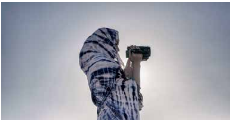
Ohiko ikasketez gain, giza eskubideetan formazioa jasotzen ari dira gazteak. M. GONZALEZ

argazki-lan komertzialak eta giza eskubideen arloko proiektu dokumentalak uztartuta. Aljerian egindako egonaldi hauetaz gain, Palestinan ere egondakoa da Gonzalez, bertako errealitatea islatu nahian.