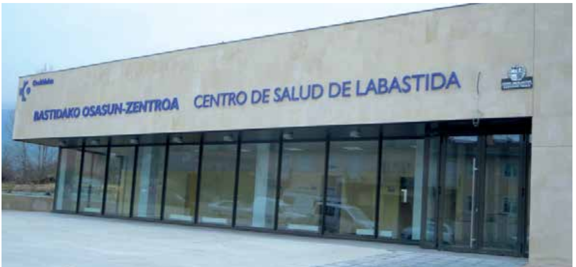
Bastidako mediku titularra laguntzeko hartzen duten errefortzua kontratatze asmorik ez du Osakidetzak. IREKIA

Halere, Zanbrana, Berantevilla eta Urizaharretik Bastidara joaten diren gaixoez ere arazoak aurkituko dituzte behar bezalako osasun arreta jasotzeko. Izan ere, ELA sindikatuak salatu duenez, Osakidetza Arabako Errioxako arduradunek "ez dute asmorik azken hamar urtean, uda garaian, Bastidako mediku titularra laguntzeko egin den kontratazioa egiteko". Orain arte, arratsaldeko errefortzua arratsaldean sortutako larrialdiez arduratzen zen.