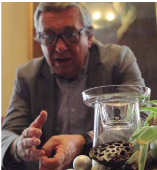
Elosegik Batzar Nagusietako bere bulegoan hartu du ALEA.