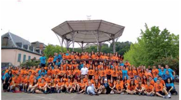
Mauleko plazan ateratako talde argazkia. EUSKARABENTURA

Euskal Herria zeharkatuko duen 798 kilometroko ibilaldia dute aurretik Euskarabentura gazte espedizioan parte hartzen ari diren 121 parte-hartzaileek. Pasa den astelehenean ekin zioten erronkari, Maulen. Ipar Euskal Herritik eta Nafarroatik ibili ostean, Arabara iritsiko dira hilaren 11n. Gesaltzan egingo dute lehen geldialdia.