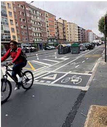
Bidegorri berriaren irudia.