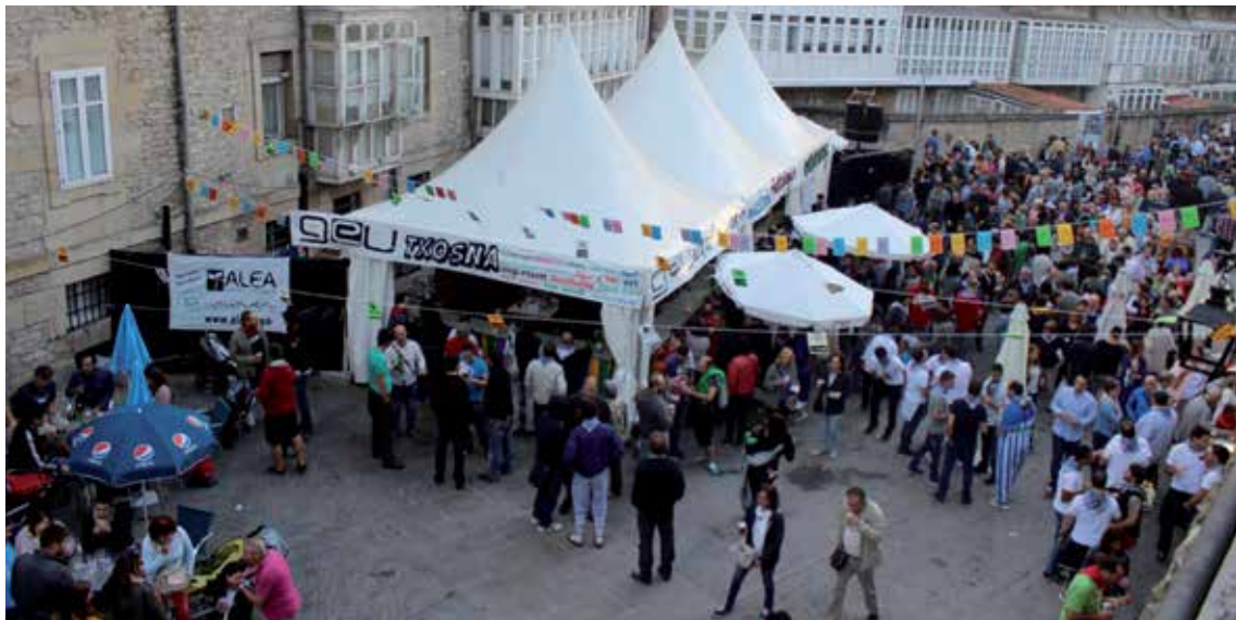
GEU txosna Aihotz plazan izango da aurtengo Andre Maria Zuriaren jaietan ere.

Aurten, abuztuaren 2an zabalduko ditu ateak txosnak, eta zortzi egunetan musikaz, dantzaz, giro alai eta euskaldunez beteko du Aihotz plaza; urtero moduan, 200 bat boluntario ibiliko dira txosnan laguntzen.