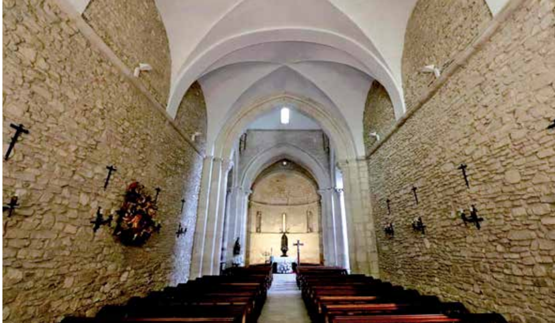
Armentia basilika da 'Ondare irekia' egitasmoan sartu duten azken eraikina. ALEA

"Aurkibide txiki bat dago, eta edukiak hiru hizkuntzetan daude, euskaraz, gazteleraz eta ingelesez. Sarrera bat eta lauzpabost minutu inguruko bideo txiki bat ere badago. Funtsean, oinarritzko informazioaren laburpen bat egin nahi dugu bertan". Ez da erabili duten baliabide bakarra: 360 graduko irudiak ere sartu dituzte, tenpluen barrualdeak ondo ikusi ahal izateko.