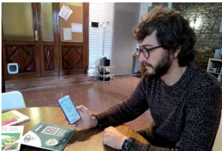
Sakelako telefonoaren nabigatzailea besterik ez da behar katalogoa ikusteko. ALEA

"Badira hainbat programa eliza horiek zuzenean bisitatzeko, adibidez Lautadan edo Gaubean, baina, beti ere, programa turistikoaren barruan, eta normalean ordutegi mugatuaren arabera. Baina gero eta bisitari gehiago daude; adibidez, Done Jakue bidea egiten dutenak", azaldu du programaren ardura duen