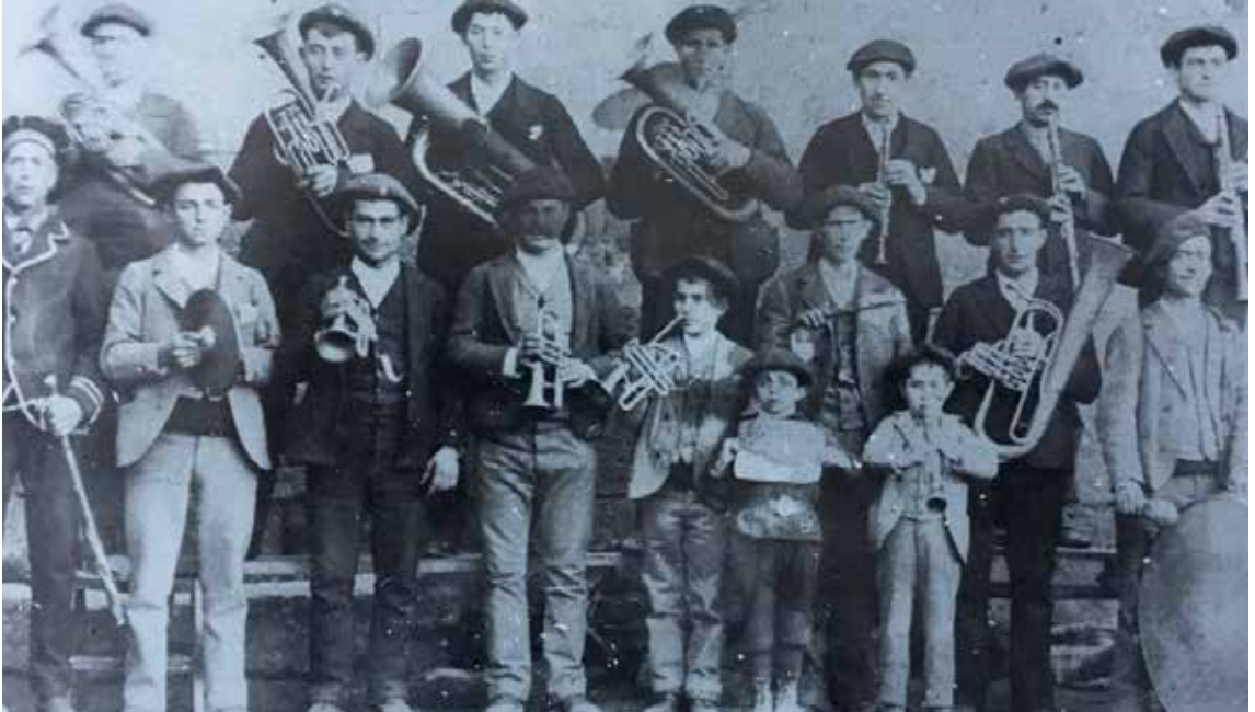
Oingo Santa Cecilia musika banda, XX. mende hasieran.