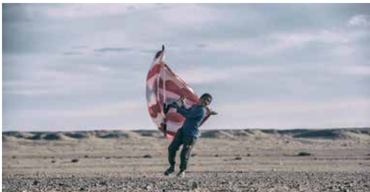
2017-2019 tartean Tindufen hartutako irudiez osatuta dago erakusketa.