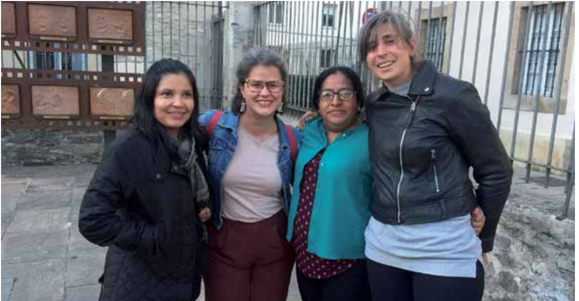
Diagnosiaren aurkezpena egin zuten hilaren 15ean Landatxon; goiko irudian, parte hartu zuten lagunak. ZENTZUZ KONTSUMITU

baldintzak zeintzuk diren kontrolatzeko ardura izango duena; horrekin lotuta, familia enplegatzaileak formatu egin behar dira. Etxeko langileei, bestetik, beren baldintzak zeintzuk diren eta familiarekin izan behar duten harremana nolakoa izan behar den azaldu behar zaie, eta ezetz esateko aukera dutela jakinaraztea. Mugimendu feministari, berriz, arazoa ikusarazten jarrai dezala eskatzen diogu eta sektorearen aldarrikapenak babestu ditzala; legegileei bizitzaren zerbitzura dauden zaintzen aldeko politikak garatu eta Lanaren Nazioarteko Erakundearen 189. Hitzarmena berretsi dezatela; sindikatuei sektorearen lan baldintzak defenda ditzatela. Adibideak baino ez dira honakoak. Zeintzuk dira hurrengo pausuak?