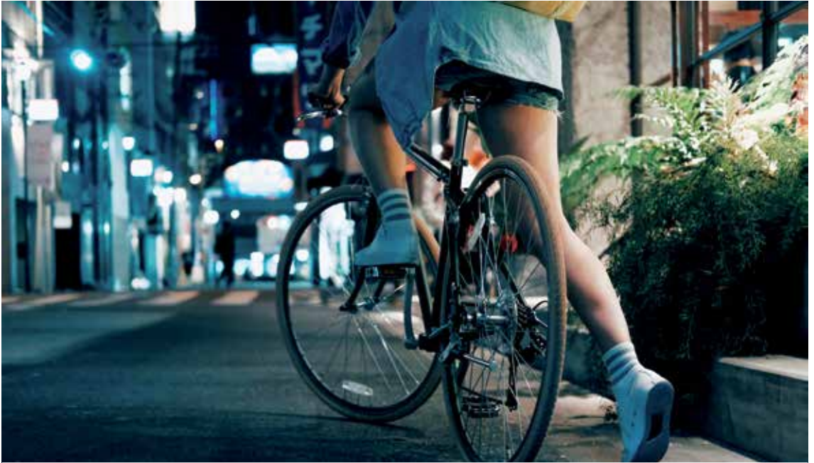
Bizikletak mugikortasunetako eta aisialdirako tresna bikaina dela aldarrikatuko dute jardunaldietan.