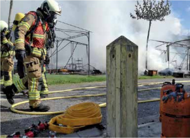
Suhiltzaileek ordubete inguru eman dute sua amatatzeko. ARABAKO SUHILTZAILEAK